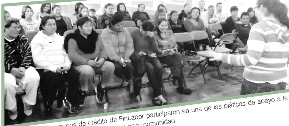
Integrantes de los grupos de crédito de FinLabor participaron en una de las pláticas de apoyo a la familia en Doxey, Hidalgo. Pronto estaremos en tu comunidad

Son ya seis las comunidades que hemos visitado para ofrecerte información sobre la mejor manera de llevar las