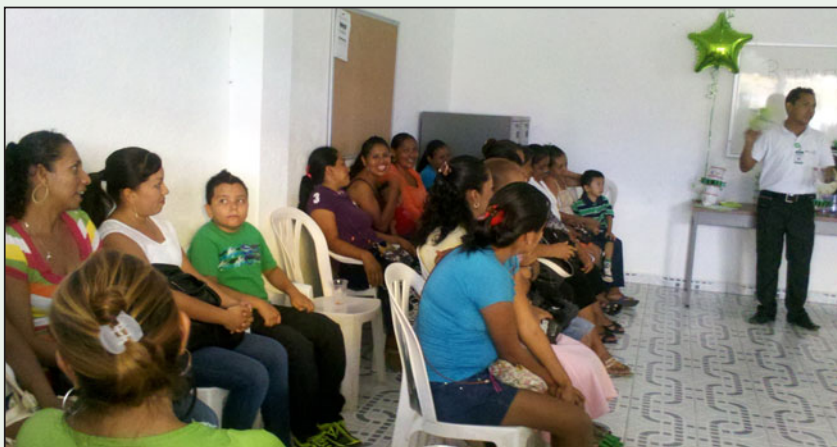
La nueva sucursal de FinLabor