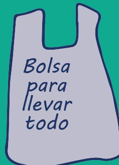
Bolsa para llevar todo